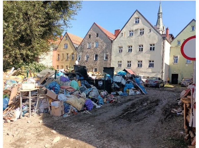
Powódź 2024, Łądek Zdrój (nad rzeką, podwórko kamienic) 21-09-2024r.