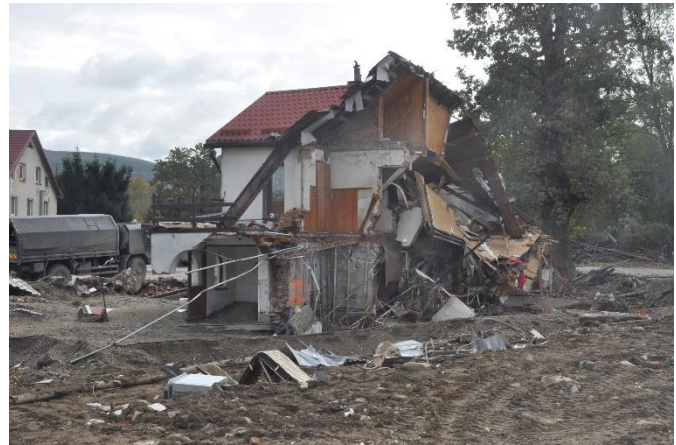
Powódź 2024, Stronie Śląskie (przerwana tama, strefa „0”) 10-10-2024r.