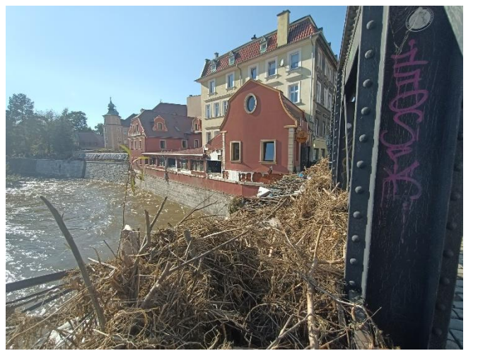
Powódź 2024, Kłodzko (sprzątanie, most na stare miasto) 21-09-2024r.